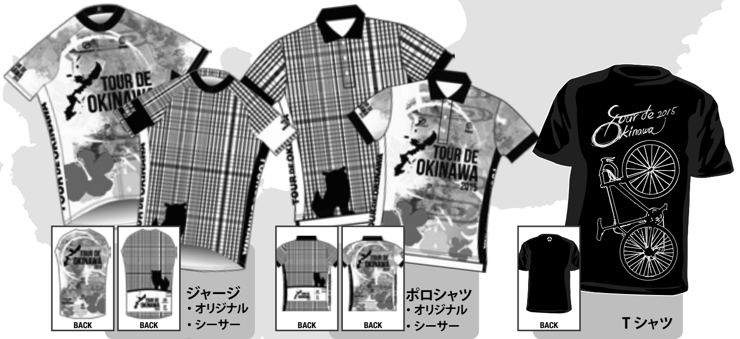
ジャージ ・オリジナル ・シーサー