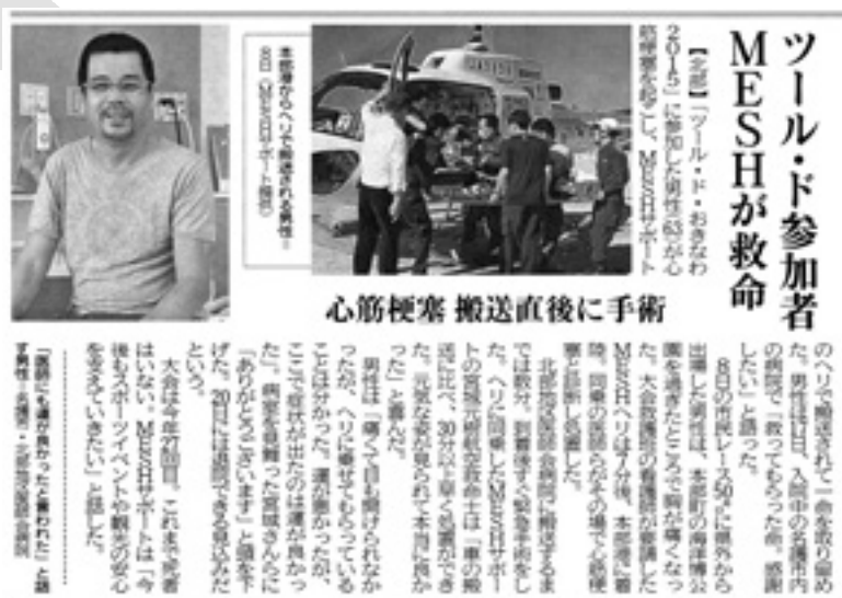
11月20日 沖縄タイムス29面