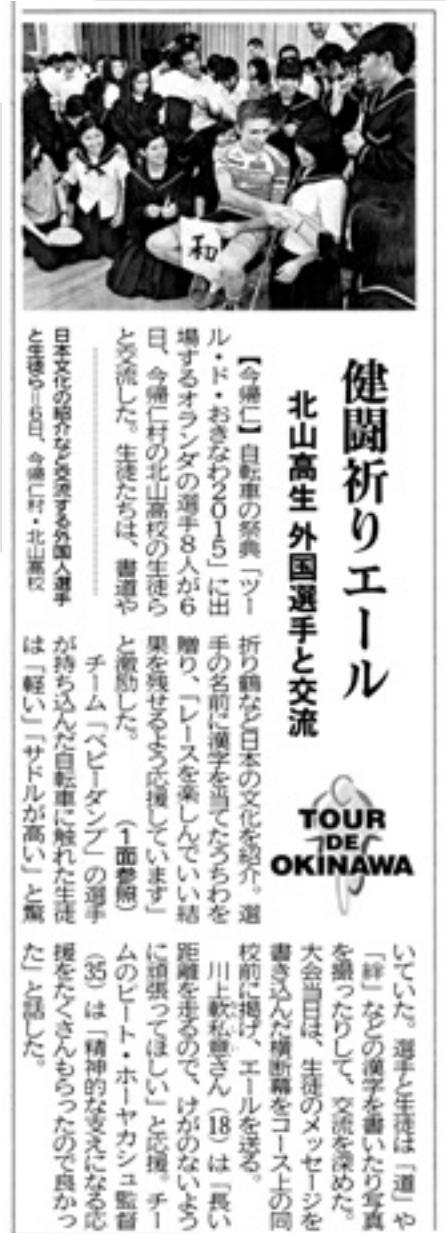
11月7日 沖縄タイムス30面