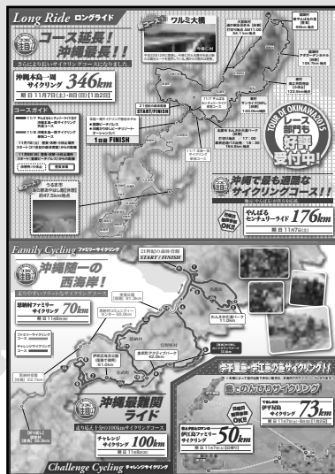
2015 募集ちらし うら