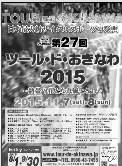
2015 募集ちらし おもて