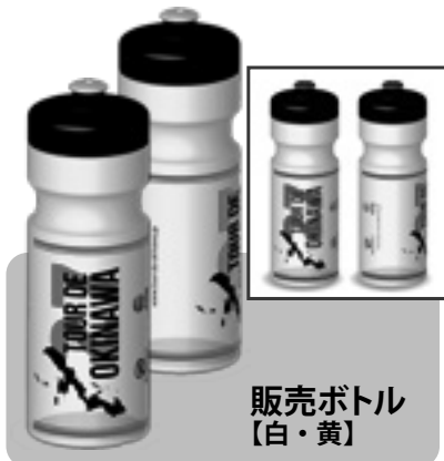
販売ボトル 【白・黄】