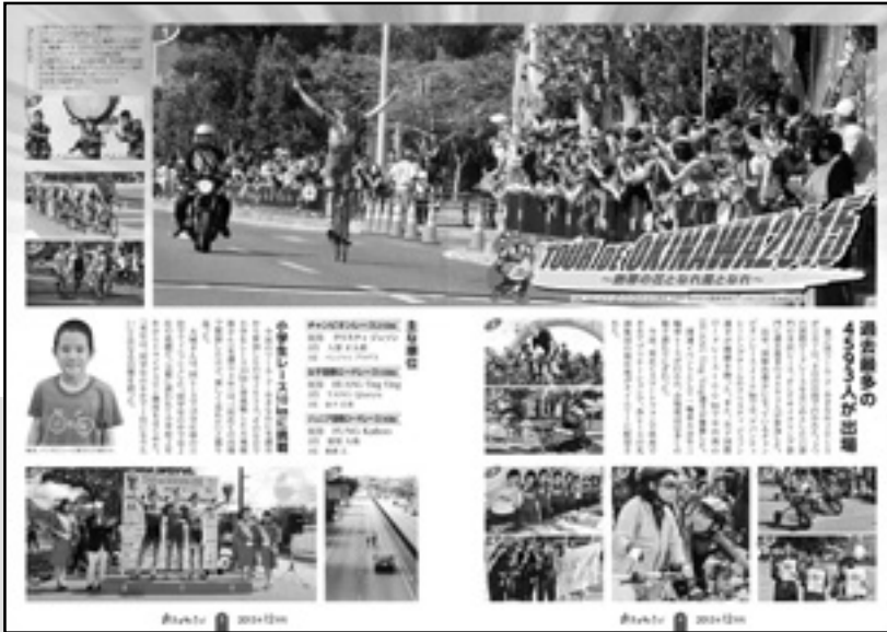
名護市広報「市民のひろば」12月号 2・3面