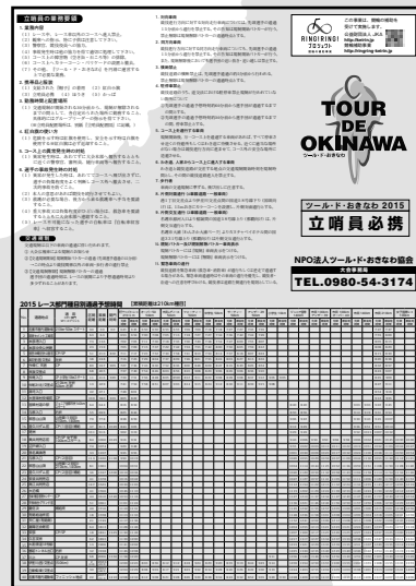
2015 立哨員必携 おもて