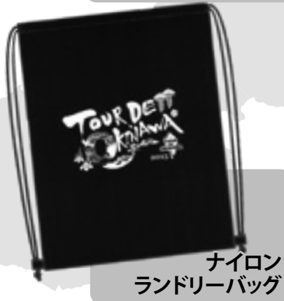
ナイロン ランドリーバッグ