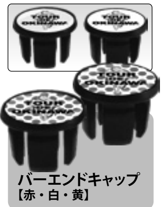
バーエンドキャップ 【赤・白・黄】