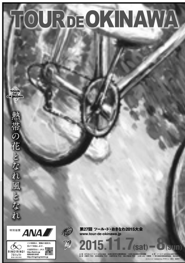
2015 プログラム 日本語版