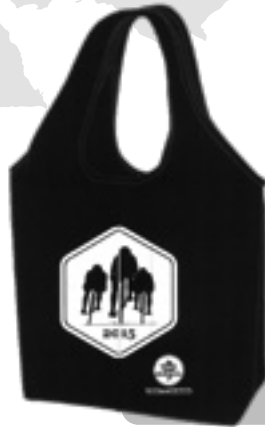
ナイロン キャリング トート