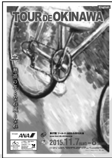
2015 プログラム 英語版