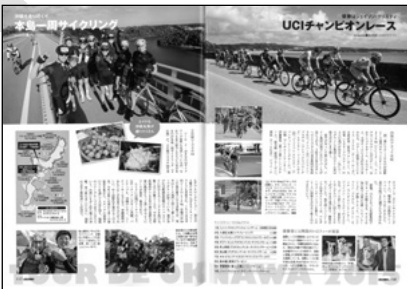
「CYCLE SPORTS」3月号 116~117ページ