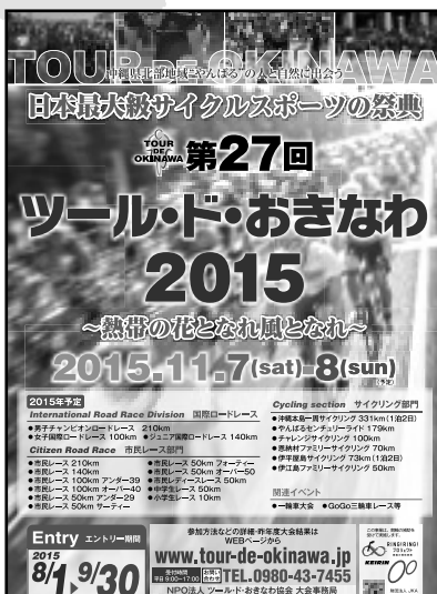
2015 雑誌掲載募集広告