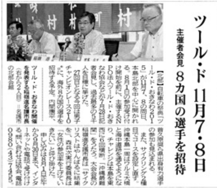
7月29日 沖縄タイムス14面