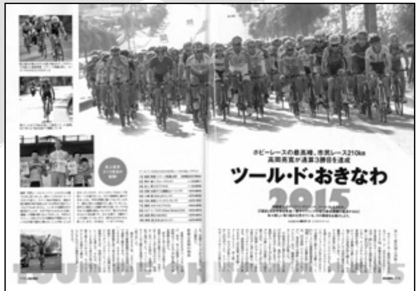
「CYCLE SPORTS」3月号 114~115ページ