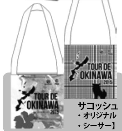
サコッシュ ・オリジナル ・シーサー